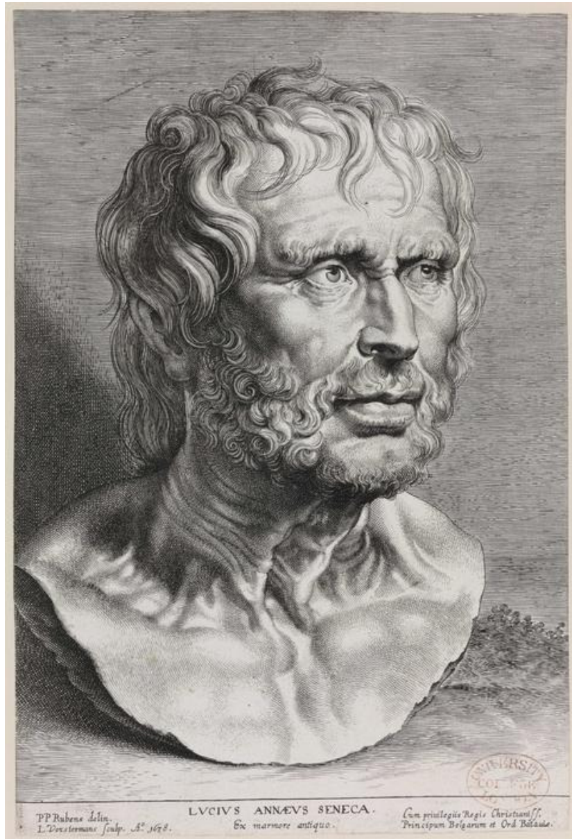
Seneca, qualem delineavit Lucas Vorsterman (1595-1675).